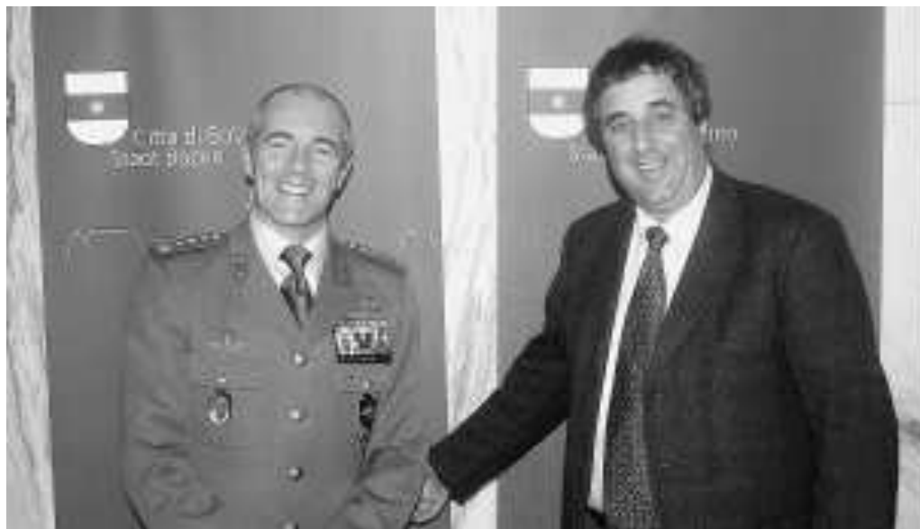
Il colonnello Massimo Giraudo con il sindaco Luigi Spagnolli ieri in municipio

BOLZANO. Il sindaco Luigi Spagnolli ha ricevuto ieri in municipio in visita di cortesia il nuovo comandante del 4° Reggimento Aviazione Esercito (Aves) Altair, il colonnello Massimo Giraudo. Nel corso dell'incontro il sindaco ha espresso a nome dell'intera comunità cittadina il saluto di benvenuto al nuovo comandante, augurandogli buona permanenza e buon lavoro. Il colonnello Massimo Giraudo è nato a Piacenza il 7 settembre 1960; ha frequentato il 162°