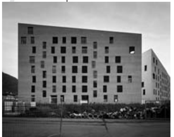
Architekturbüro Mayr Fingerle (Kaiserau/Firmiano) Preis Architektur/Premio Architettura