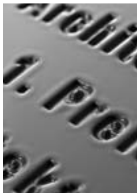
Titelseite / Copertina:

Detail Siegerplakette/targhetta premio, dettaglio