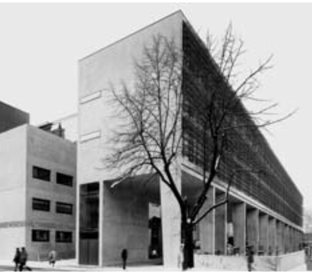
Höller & Klotzner Architekten (Bozen/Bolzano) Preis Architektur/Premio Architettura