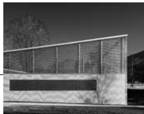
MODUS architects (Brixen/Bressanone) Preis Architektur/Premio Architettura