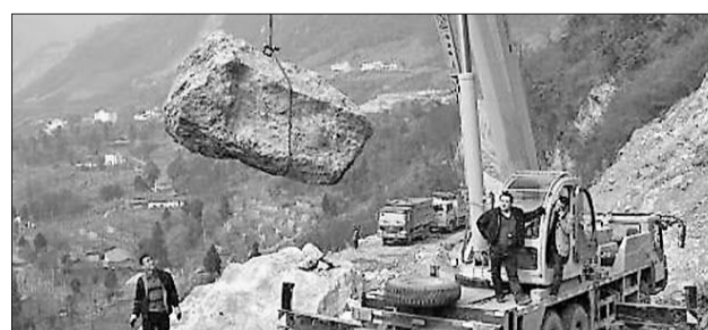
Dieser Brocken hat sich in China beim Erdbeben 2008 von einem Felsen gelöst. Ai Weiwei ließ ihn gestern auf den Dachstein hieven. Ai Weiwei

Der im Jahr 1957 in China geborene Ai Weiwei gilt als führender Vertreter der Gegenwartskunst in seinem Land und als scharfer Kritiker des politischen