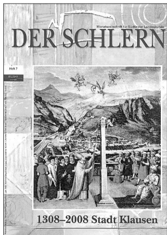
Das Titelbild zeigt den hl. Kassian, der ein Götzenbild stürzt. Der Schlern