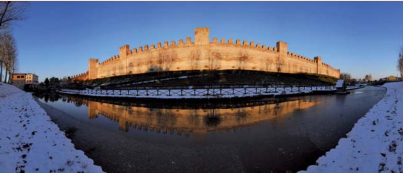
Die mit Mauern umgebene Stadt Cittadella

Besuch des Kerkers im Palazzo Ducale, wo Speziale eingesperrt wurde. Am Abend Opernbesuch.