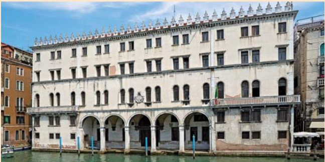
Fondaco dei Tedeschi, Handelshaus der Deutschen, Venedig