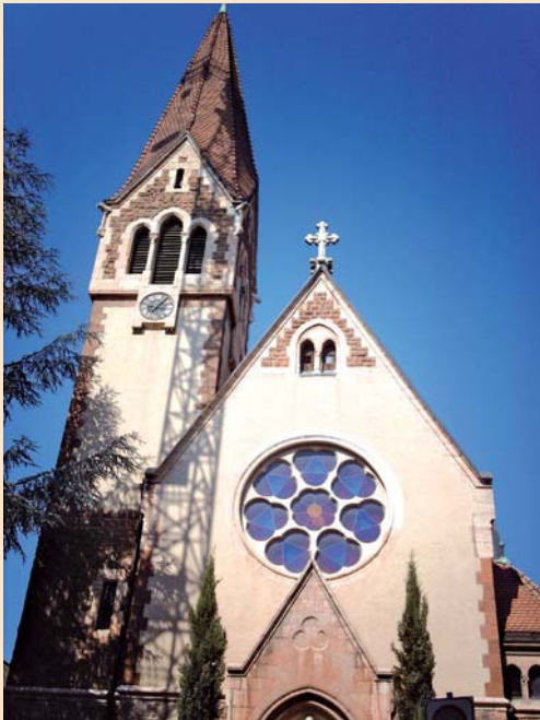
Evangelische Christus-Kirche, Bozen-Gries

Treffpunkt: 17.30 Uhr in der Christus-Kirche in Bozen