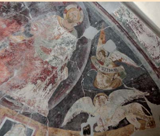
Apsisfresko in St. Laurentius, Rentsch

Treffpunkt: 15.00 Uhr vor der St.-Laurentius-Kirche in Rentsch