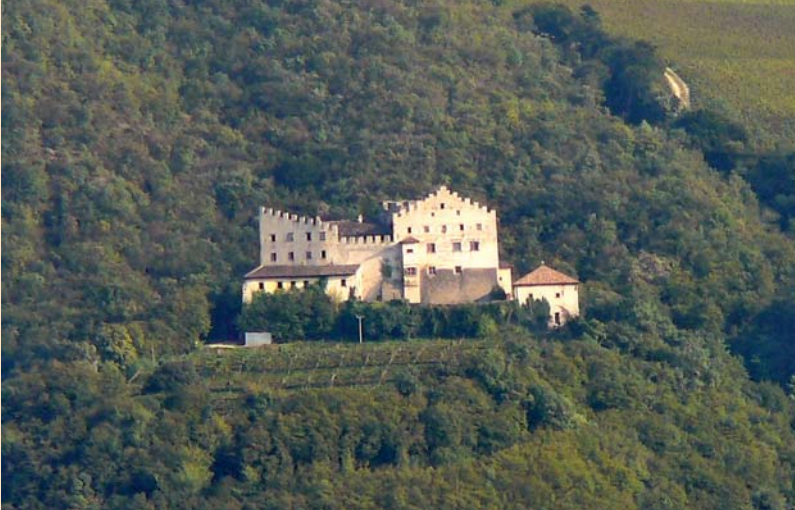
Schloss Königsberg, Faedo